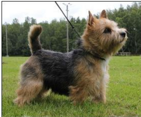
Copperstone Lady's Evening Dress Uppf. Marureen Klerell Äg. Lotta Witt Hegardt