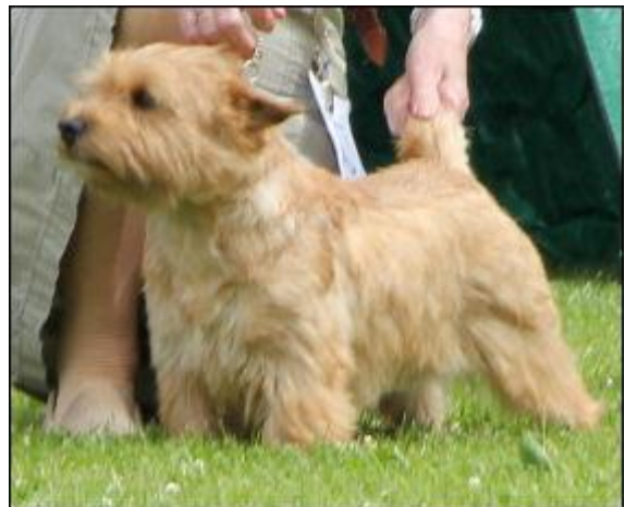
Copperstone Red Gold Uppf & äg. Maureen Klerell