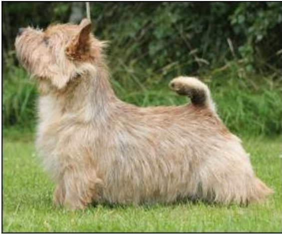
SE JV-14 SE V-14-15 Wich Hound's Hidden Design Uppf & äg. Marita Billström